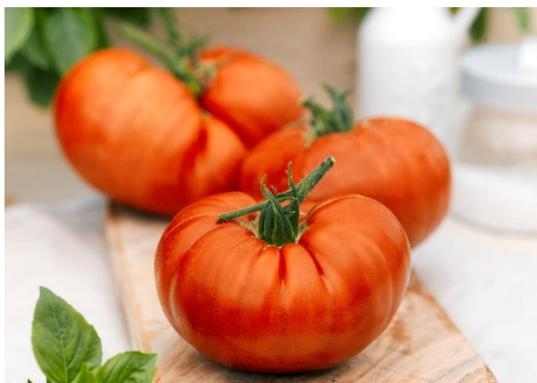
„Supersteak“ Tomate F1